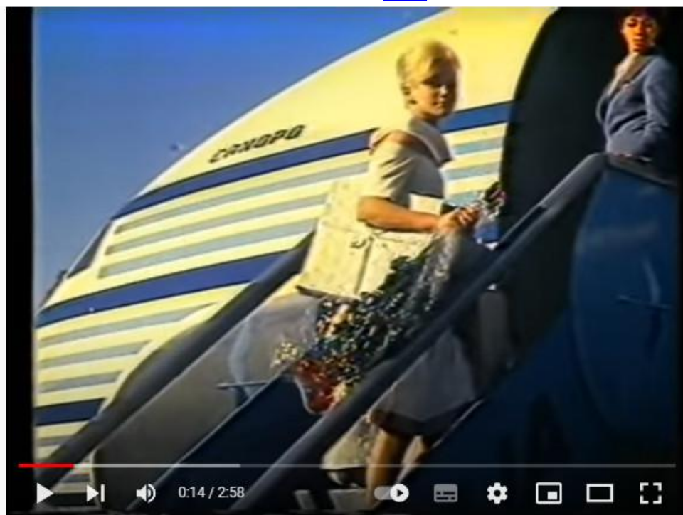
Carosello - Punt e Mes 1964